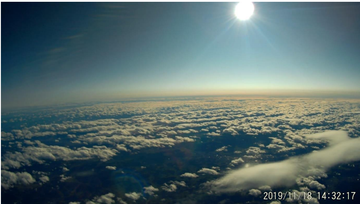
Blick auf Wernau und Plochingen aus 2000m Höhe